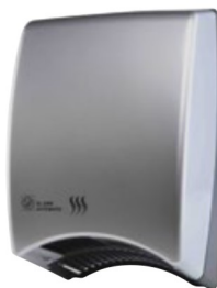
SL-2008 AUTOMATIC SILVER