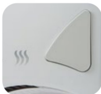
Spouštěcí tlačítko SL-2008