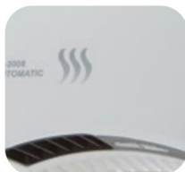
Senzor pohybu SL-2008 AUTOMATIC / AUTOMATIC SILVER